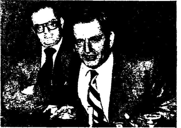
المبعوث الدولي أولوف بالمبا يعقد مؤتمرا صحفيا في جنيف في طريقه إلى طهران.

طهران - بغداد - الوكالات - قال أمس السيد أولوف بالمبا رئيس وزراء السويد السابق ومبعوث السكرتير العام للأمم المتحدة الدكتور كورت فالدهايم، إلى كل من العراق وايران أنه جاء إلى طهران للوقوف عن كثب على موقف المسؤولين الإيرانيين من إمكانية تسوية النزاع مع العراق بالطرق السلمية.